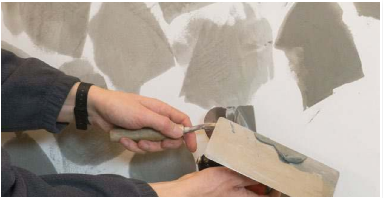
Mit wenig Material auf der Kelle arbeiten.