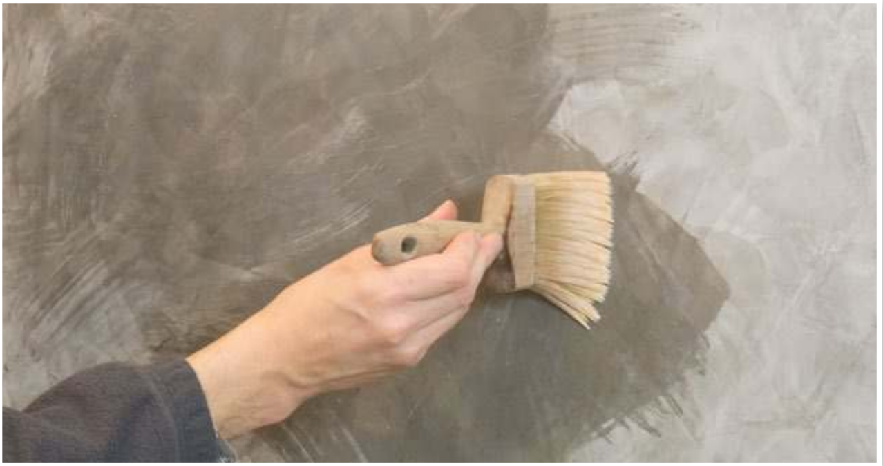
Glätteseife auf Teilstücke auftragen.