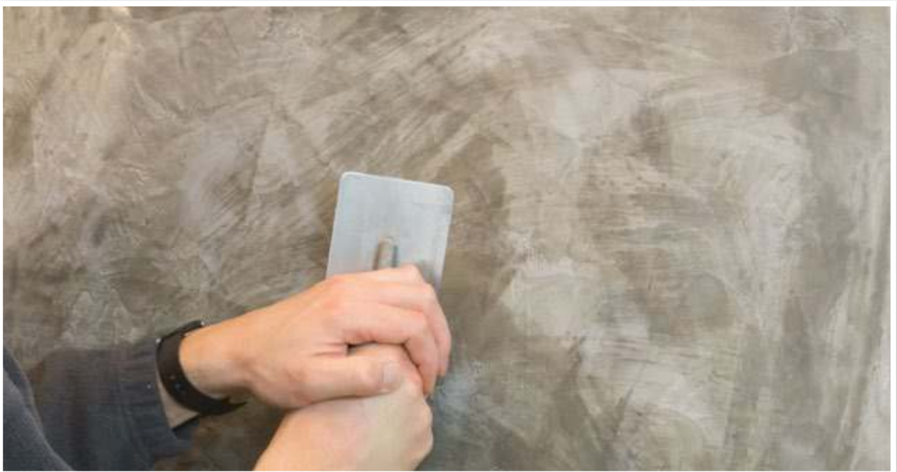
Die geseifte Oberfläche mit Druck verpressen.